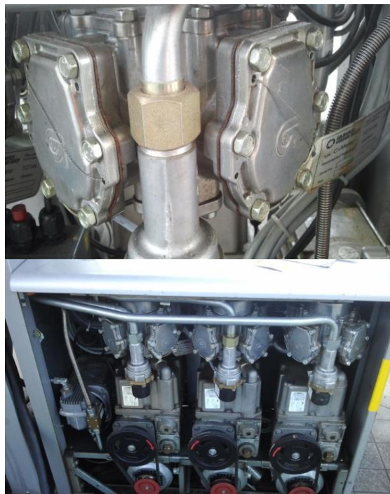
foto: targhetta metrica, contrassegni di scadenza, l'interno di un distributore di carb.