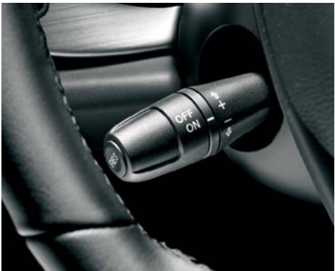
416 Cruise control