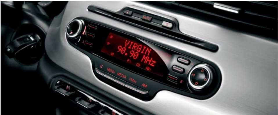
41A Alfa sound system con lettore CD/Mp3 e 6 altoparlanti (di serie)