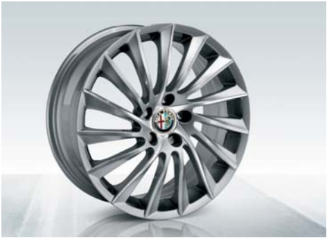
435 Cerchi in lega da 18" sportivi a turbina con pneumatici 225/40