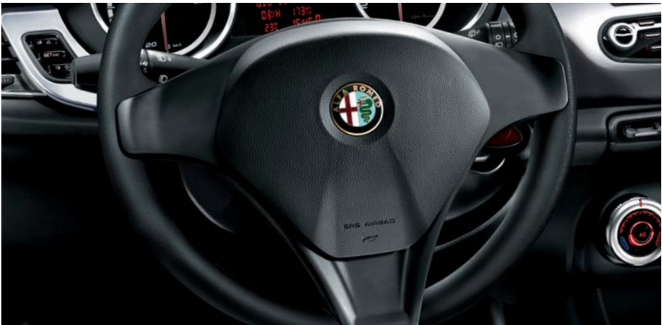
320 Volante in pelle con mostrina nero opaco (di serie)