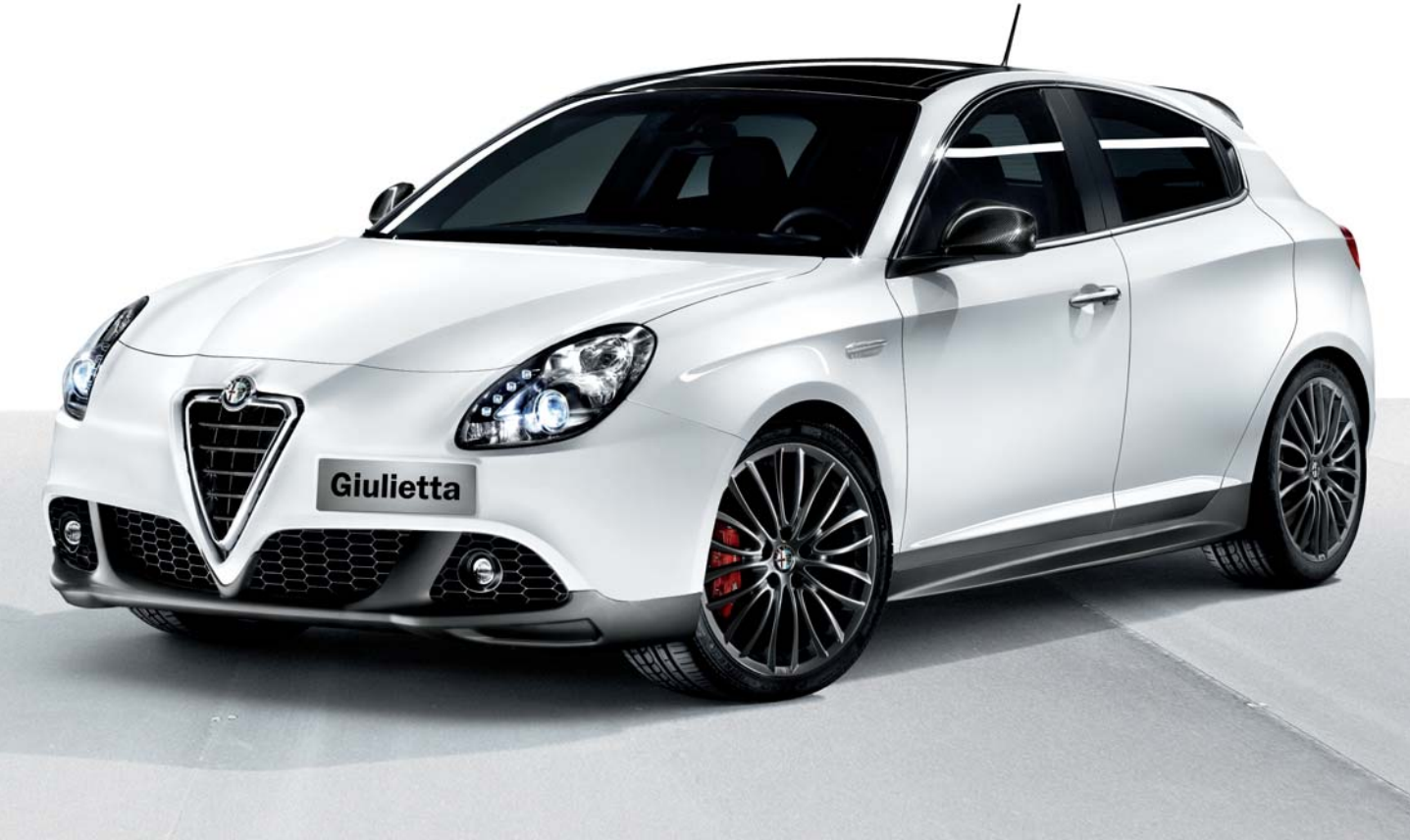
Dam anteriore e minigonne

Per conoscere tutti i prodotti della Lineaccessori, consulta il catalogo dedicato.