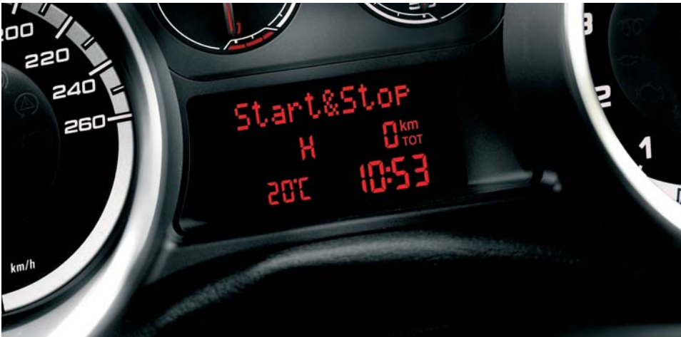
Start & Stop con Gear Shift Indicator (di serie)