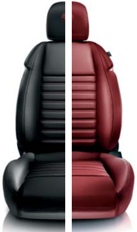
Pelle a cannelloni

408 Nero intrecciato (opt) 465 Cuoio intrecciato (opt)