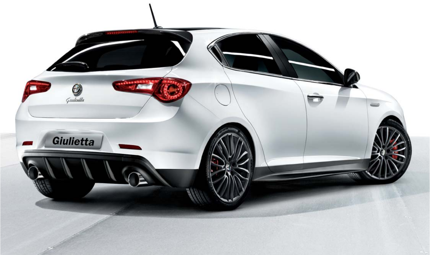
Dam posteriore e minigonne