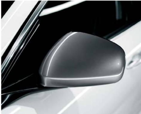
Calotte specchietti esterni in grigio titanio