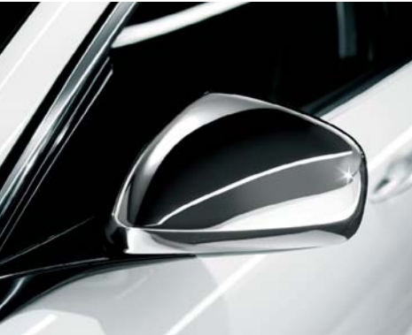
Calotte specchietti esterni in cromo lucido