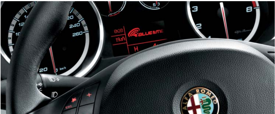
65W Blue&Me con vivavoce Bluetooth, USB, AUXin (di serie)