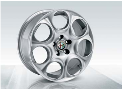
421 Cerchi in lega da 17" sportivi a 7 fori con pneumatici 225/45