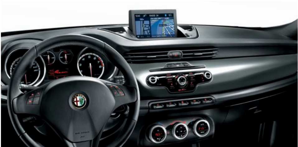
Inserto plancia in vernice Grigio Magnesio (di serie)