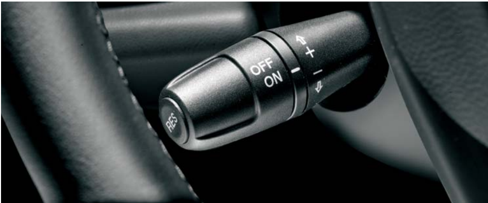
416 Cruise Control (di serie)