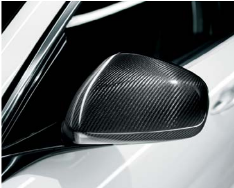
Calotte specchietti esterni in carbonio