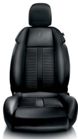
Pelle e tessuto microfibra 323 Nero con cuciture rosse (di serie)