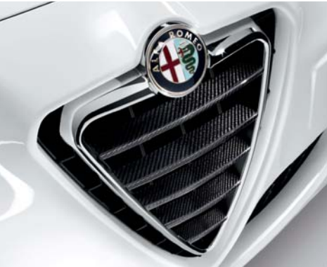
Kit mostrine calandra in carbonio