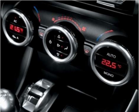
140 Alfa dual zone automatic climate control