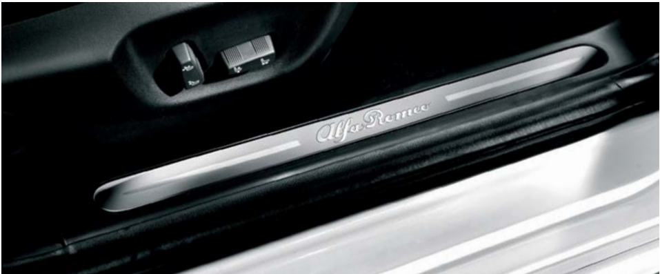
018 Batticalcagno in alluminio