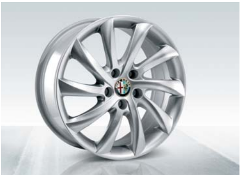
420 Cerchi in lega da 17" sportivi a turbina con pneumatici 225/45