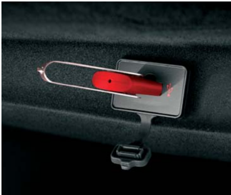
Presa usb (di serie)