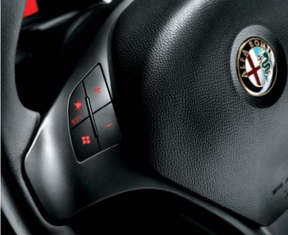
245 Comandi radio al volante (di serie)