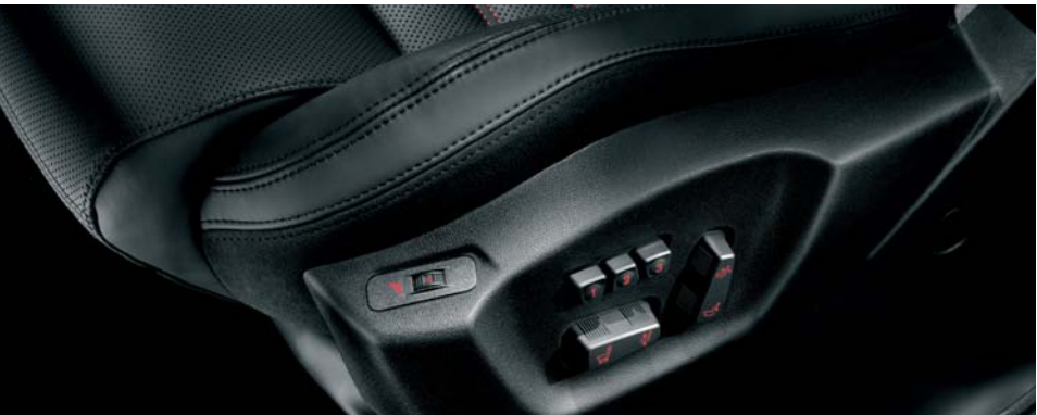
452 Sedili anteriori riscaldati