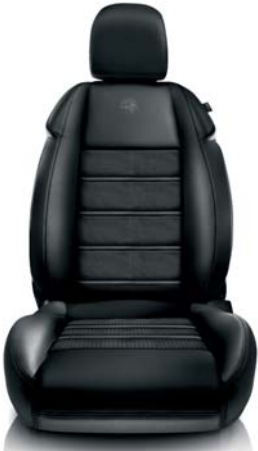
Pelle 402 Nero intrecciato (opt)