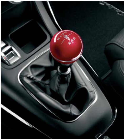
Pomello cambio Rosso Competizione