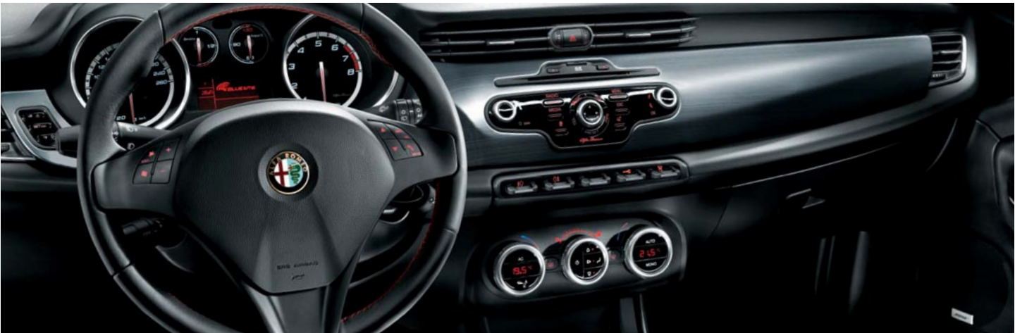
321 Volante in pelle con mostrina nero opaco e cuciture rosse - 4MP Inserto plancia in alluminio spazzolato brunito