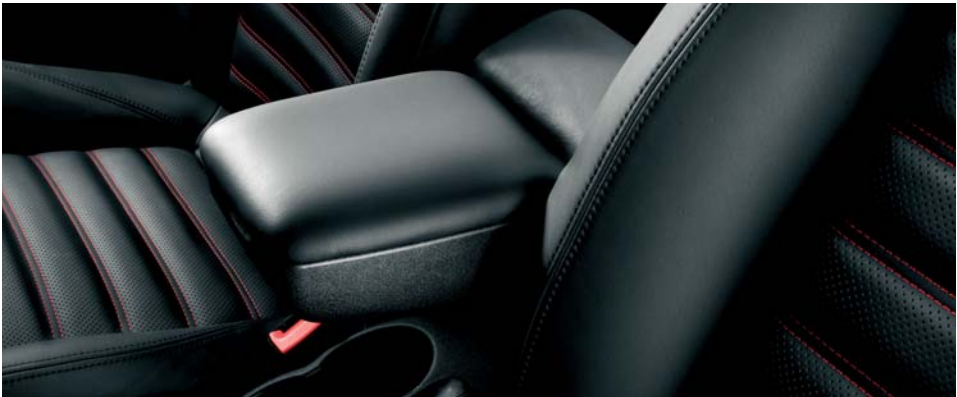
132 Bracciolo anteriore (di serie)