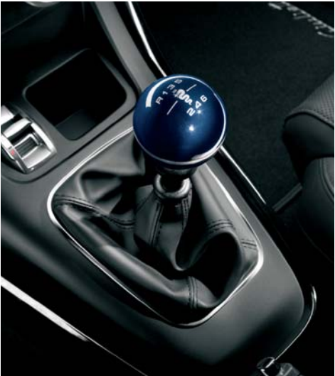
Pomello cambio Blu Profondo