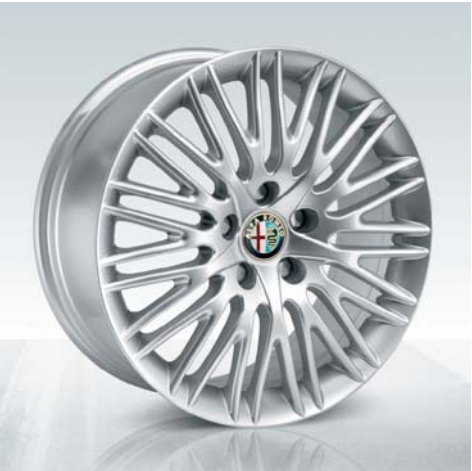
433 Cerchi in lega da 17" eleganti (di serie)

423 Nero con cuciture rosse (opt) 401 Rosso con cuciture rosse (opt)