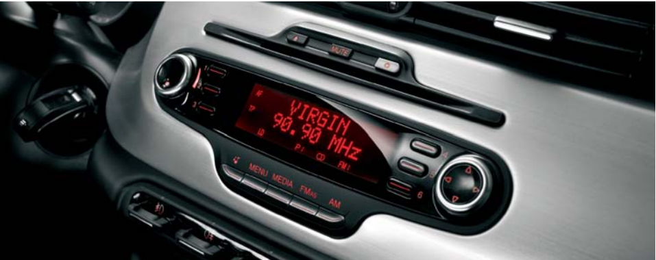
41A Alfa Sound System con lettore CD/Mp3 e 6 altoparlanti