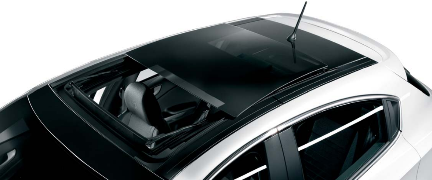
400 Tetto apribile ad ampia vetratura (vincola Black interiors opt 5KW)