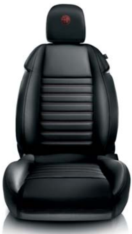
Pelle a cannelloni 923 Nero con cuciture rosse (opt)

IL QUADRIFOGLIO. Un simbolo che ha forti radici nel passato Alfa Romeo e che ha firmato le grandi vetture da competizione. Giulietta porta il Quadrifoglio in una nuova era, una vettura che assicura la perfetta combinazione tra sportività e fascino contemporaneo. Le prestazioni sono quelle del 1750 Turbobenzina a iniezione diretta da 235 CV con doppio variatore di fase continuo e sovralimentazione con sistema scavenging e intercooler. Il rapporto peso/potenza di 5,6 kg/CV, l'assetto sportivo con sospensioni ribassate e l'impianto frenante potenziato, garantiscono un handling e un comportamento su strada da sportiva di razza.