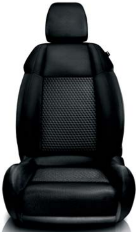
Tessuto Sprint 298 Nero (di serie)