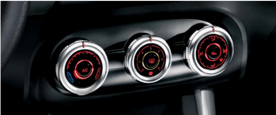
Alfa climate control (di serie)