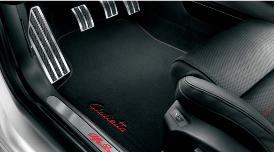
Kit pedaliera sportiva più appoggia piede in alluminio, Kit batticalcagni illuminati (solo anteriori) e kit tappeti "Giulietta" con cucitura rossa