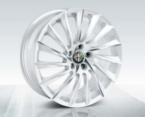
Kit cerchi in lega da 18"