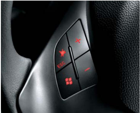
709 Comandi radio e telefono al volante