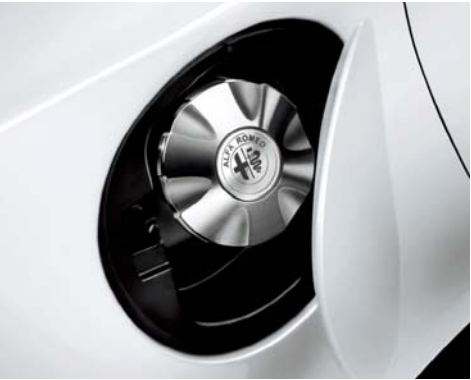
Tappo benzina in alluminio