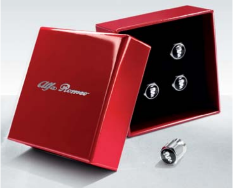
Kit coprivalvole pneus con logo