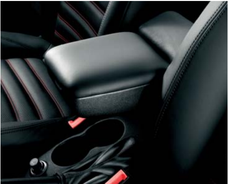
132 Bracciolo anteriore con vano portaoggetti