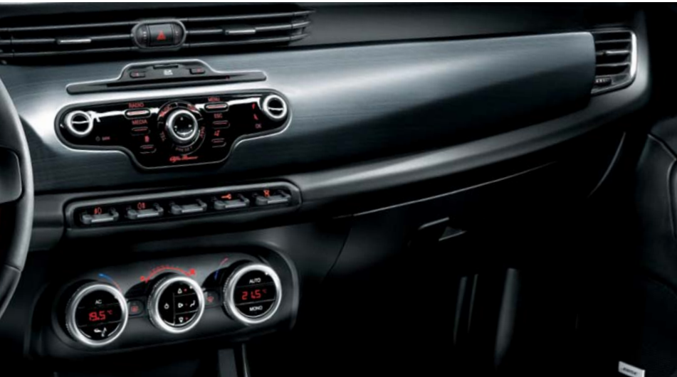
Kit mostrine ricoprimento plancia alluminio spazzolato brunito