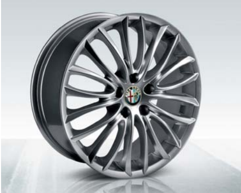
Kit cerchi in lega da 18" disegno 8C