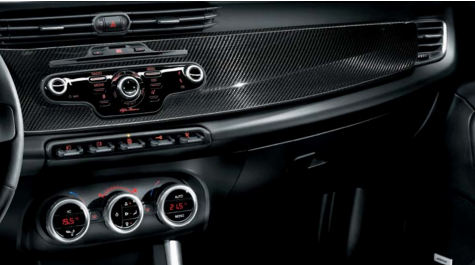
Kit mostrine ricoprimento plancia in carbonio

Per conoscere tutti i prodotti della Lineaccessori, consulta il catalogo dedicato.