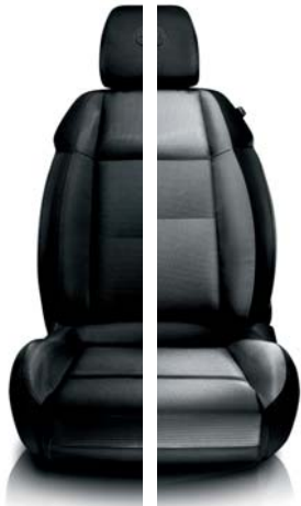
Tessuto Competizione 168 Nero (di serie) 125 Nero-Grigio (alternativa di serie)