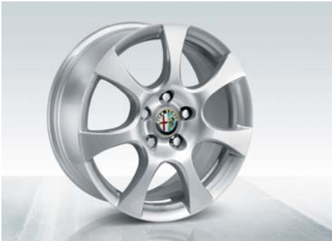
431 Cerchi in lega da 16" eleganti con pneumatici 205/55