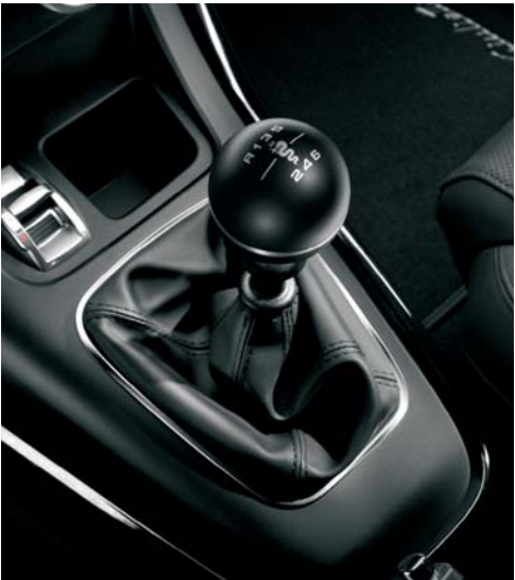
Pomello cambio Nero Opaco