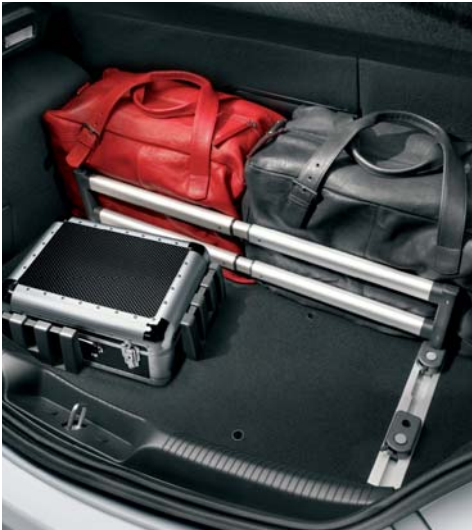
Organizer vano bagagli con accessori