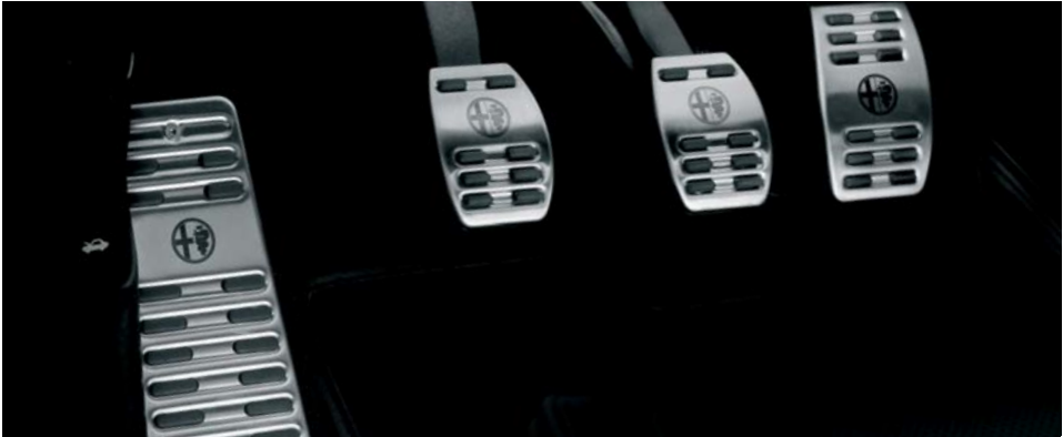
4CS Pedaliera sportiva in alluminio