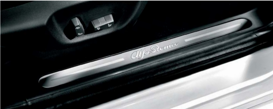
018 Batticalcagno in alluminio