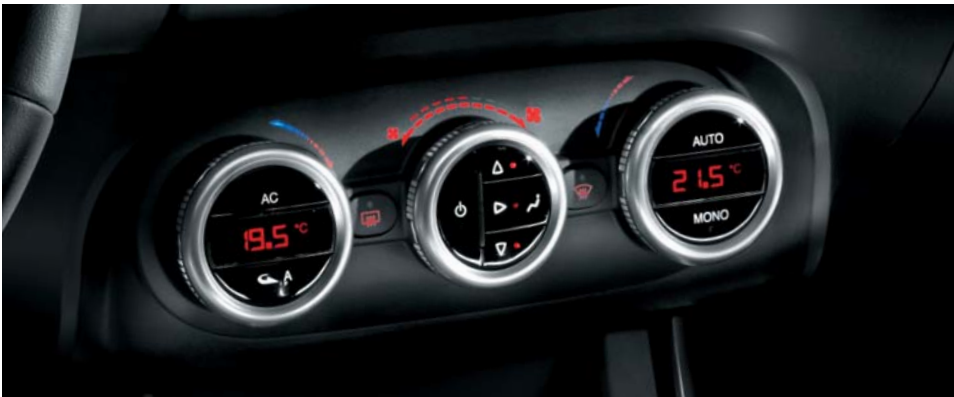
140 Alfa dual zone automatic climate control (di serie)