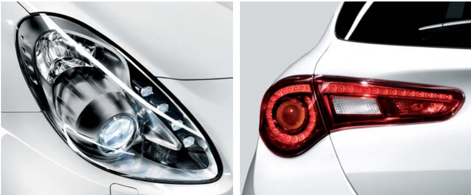
Proiettori anteriori e fanali posteriori a led (di serie)