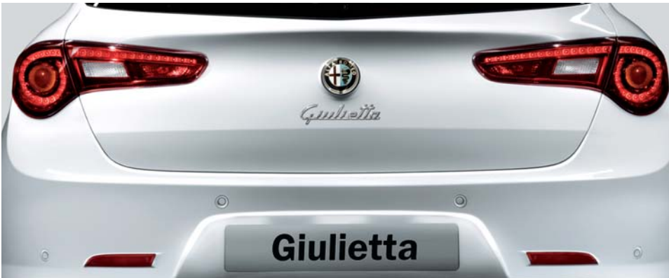
52B Sensori di parcheggio posteriori (di serie)