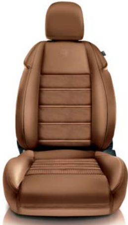
Pelle 495 Cuoio intrecciato (opt)