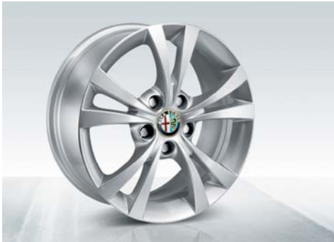
432 Cerchi in lega da 16" sportivi con pneumatici 205/55