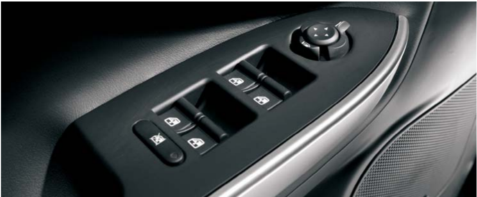
023 Alzacristalli elettrici anteriori e posteriori (di serie)