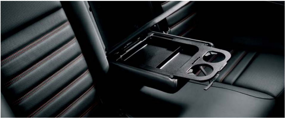
275 Bracciolo con carico passante (di serie)