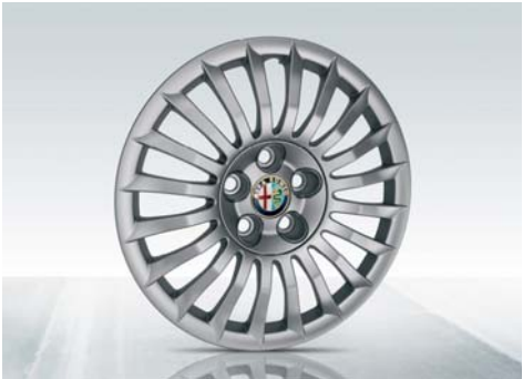
Cerchio in acciaio da 16" con pneumatici 205/55