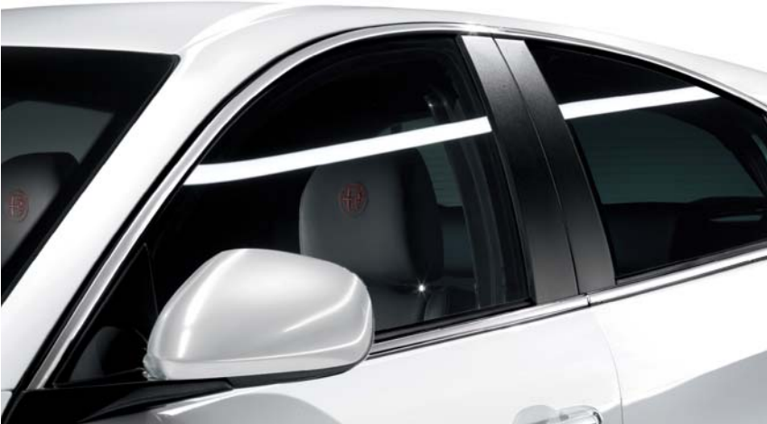
Chrome line esterna (di serie)