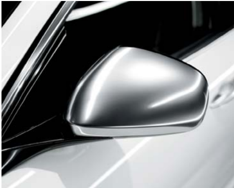
Calotte specchietti esterni in cromo satinato