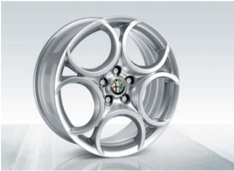
439 Cerchi in lega da 18" sportivi a 5 fori con pneumatici 225/40