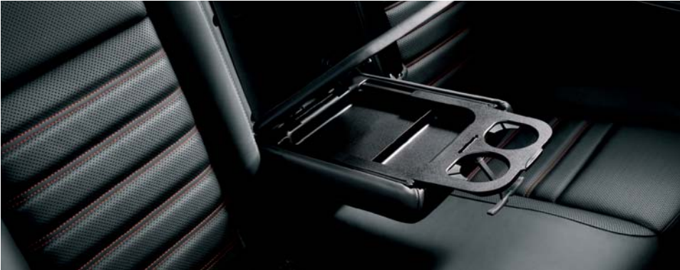
275 Bracciolo con carico passante