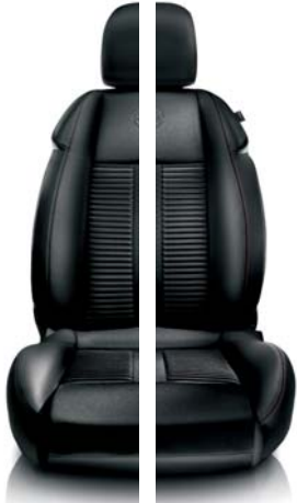
Pelle e tessuto microfibra

341 Nero con cuciture nere (di serie) 323 Nero con cuciture rosse (opt)