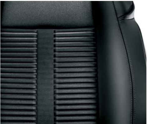
341 Pelle e tessuto microfibra (di serie)