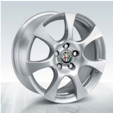
431 Cerchi in lega da 16" eleganti (di serie)