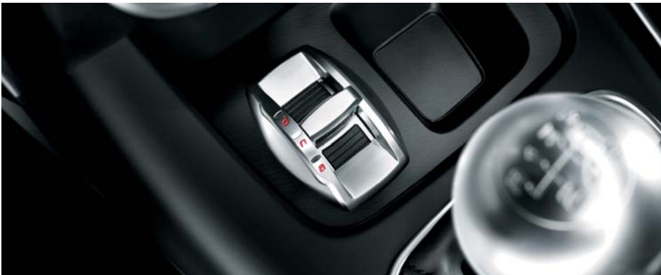
Alfa Romeo D.N.A. (di serie)