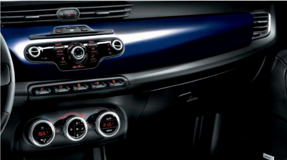
Kit mostrine ricoprimento plancia Blu Profondo