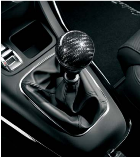
Pomello cambio in carbonio