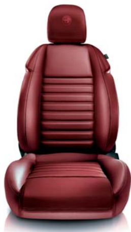
Pelle a cannelloni 901 Rosso con cuciture rosse (opt)