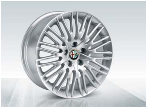
433 Cerchi in lega da 17" eleganti a raggi con pneumatici 225/45