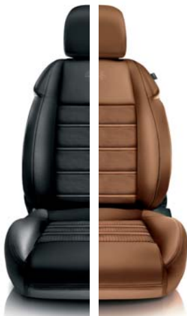
Pelle 408 Nero intrecciato (opt) 465 Cuoio intrecciato (opt)