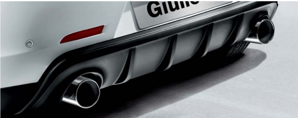
Kit doppio terminale di scarico maggiorato