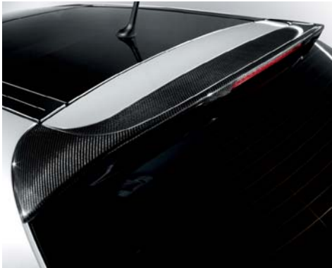
Spoiler posteriore in carbonio