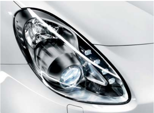
230 Proiettori Bi-Xeno con Adaptive Frontlight System