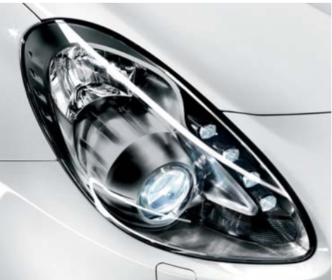
5EM Proiettori con finizione scura