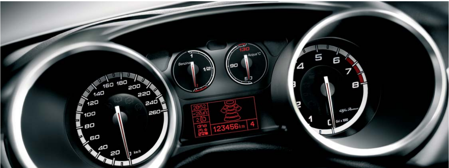
Strumento di bordo con Trip Computer