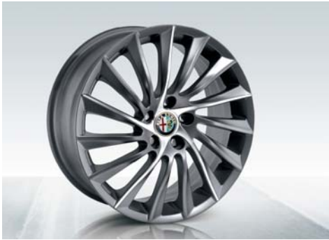
55E Cerchi in lega da 18" sportivi a turbina con trattamento scuro e pneumatici 225/40