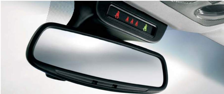
SBR (Seat Belt Reminder): display indicatore cinture sicurezza