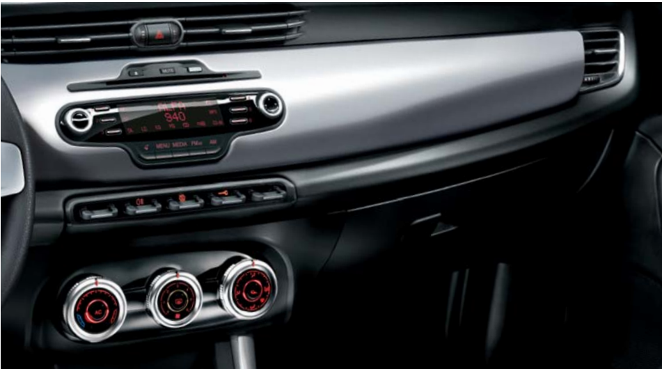
Kit mostrine ricoprimento plancia alluminio chiaro