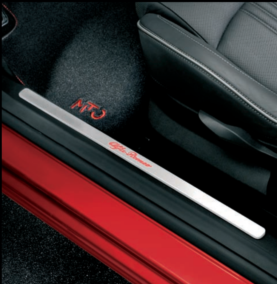
BELEUCHTETE EINSTIEGSLEISTE MIT ALFA-ROMEO-SCHRIFTZUG