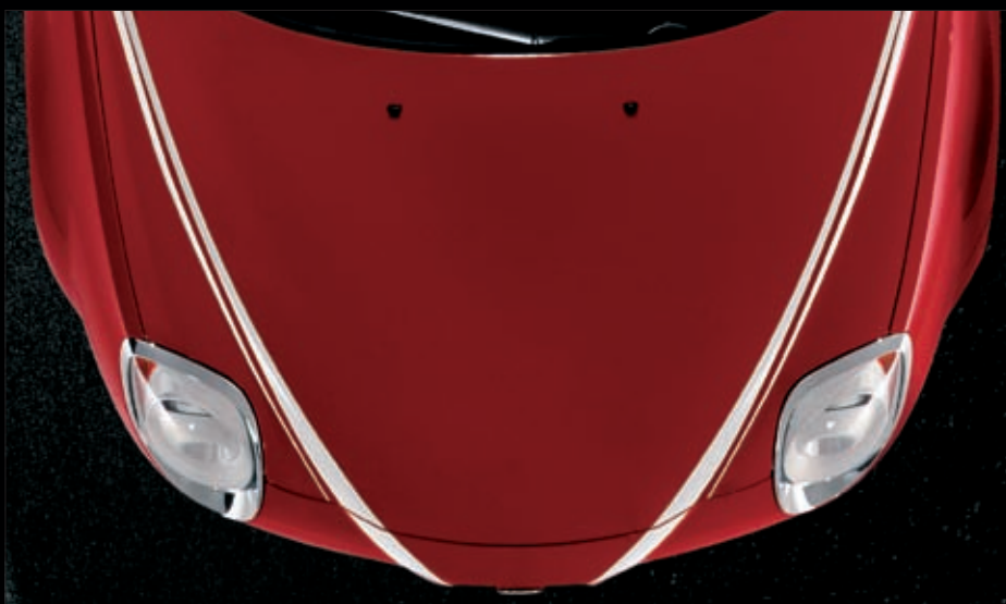
AUFKLEBER STREIFEN ITALIENISCHE FLAGGE