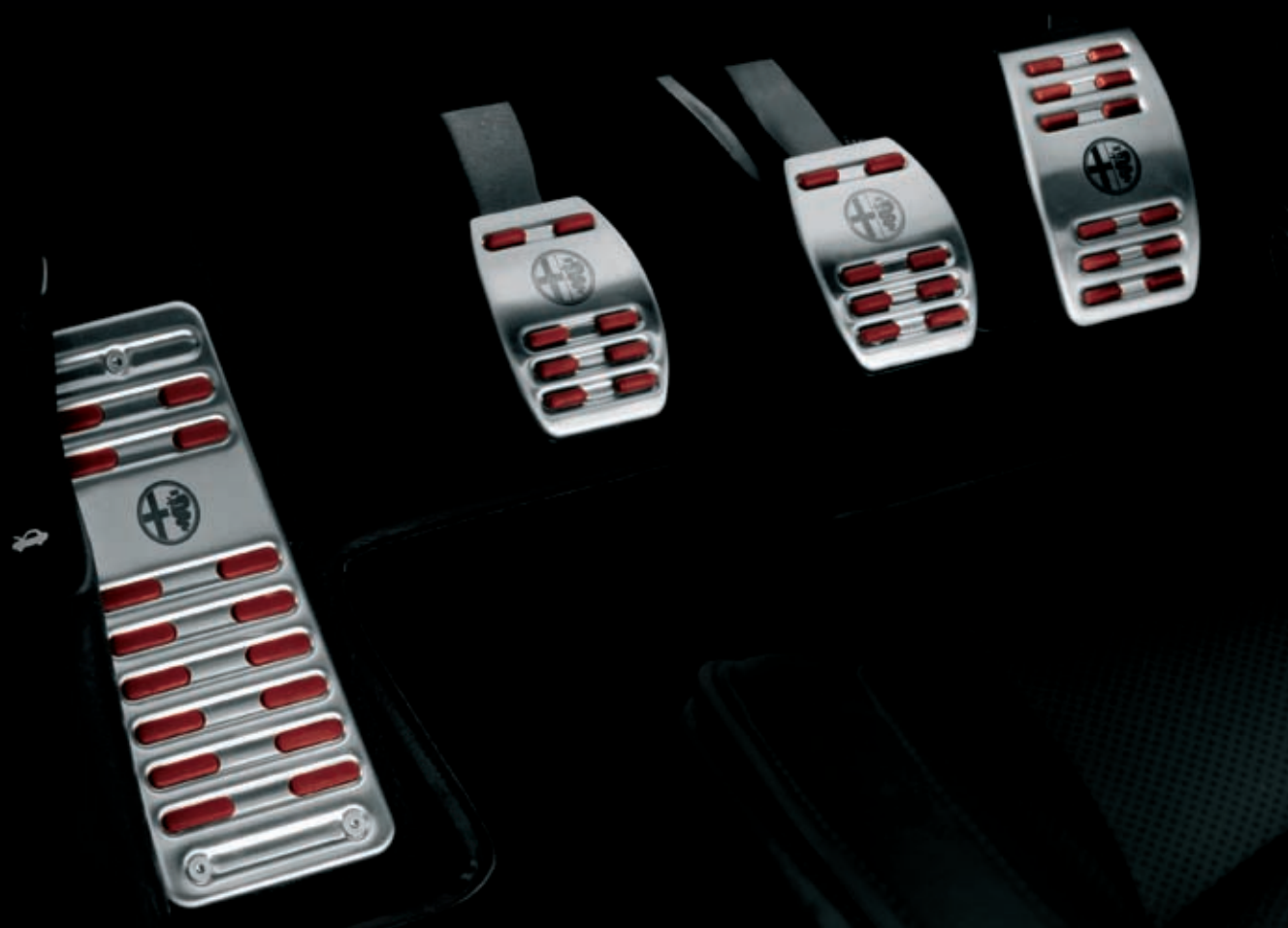
SPORTLICHE FUSSSTÜTZE FAHRERSEITE