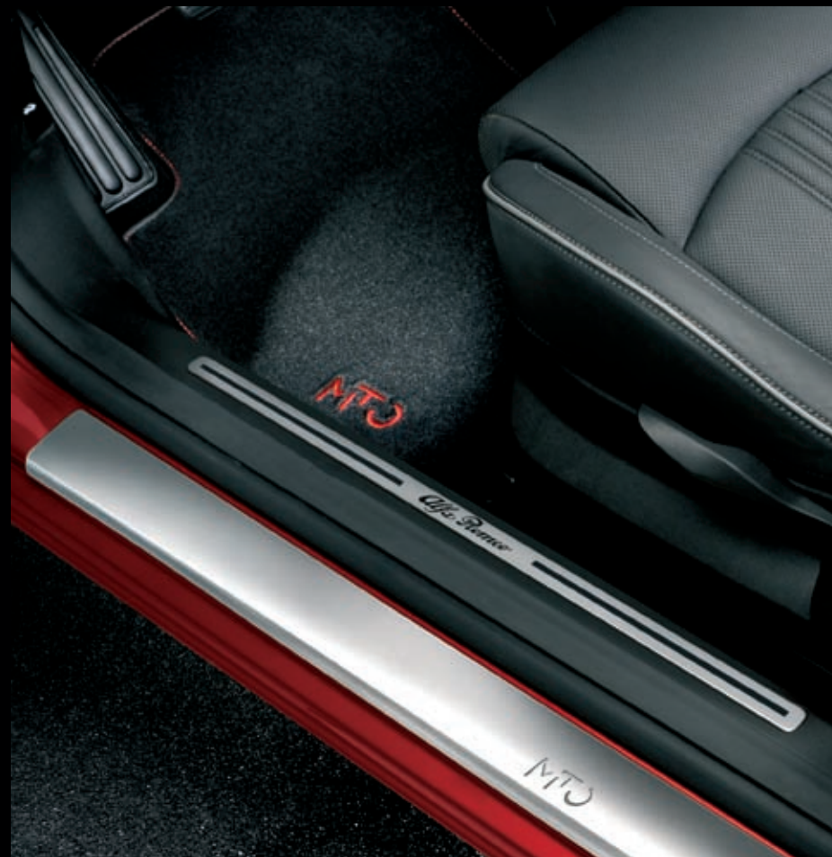
EINSTIEGSLEISTE AUS EDELSTAHL MIT MITO-SCHRIFTZUG