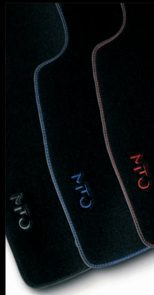
* SET GUMMIFUSSMATTEN