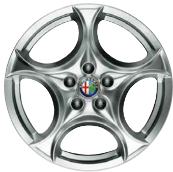
432 Ruote in lega leggera disegno a fori 17"