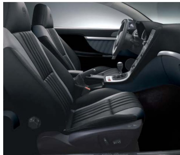
402 Pelle Nero / Grigio