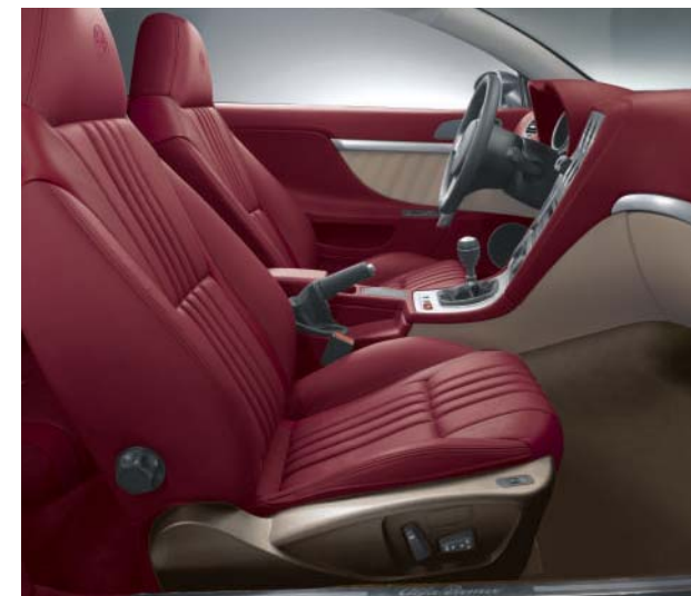
901 Pelle Frau® "Pieno Fiore" Rosso