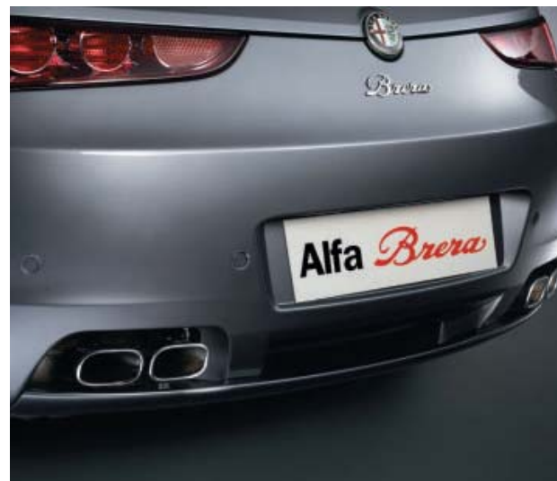
Doppio terminale di scarico