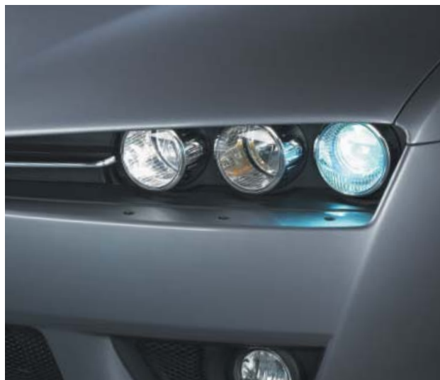
Fari bi-xenon e lavafari