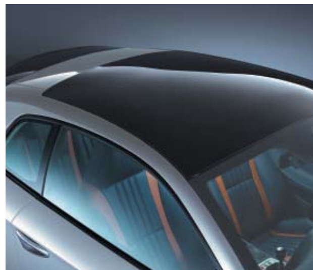
Sky Window chiuso