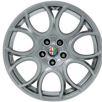
56J Ruote in lega leggera disegno a fori 18"