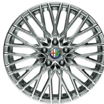
439 Ruote in lega leggera disegno a raggi 18"