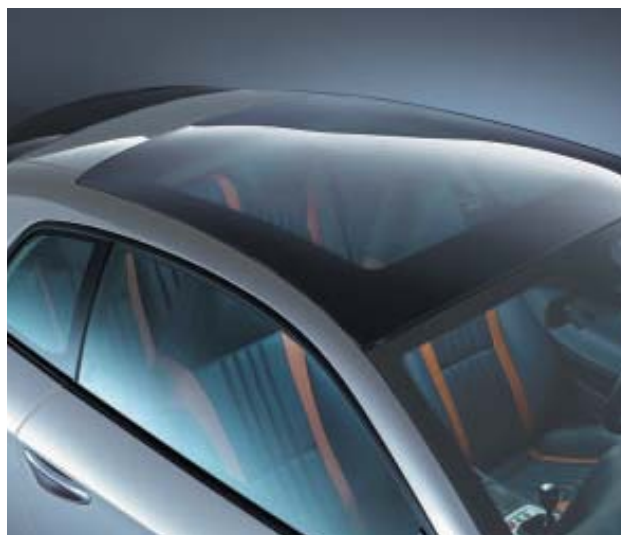
Sky Window aperto