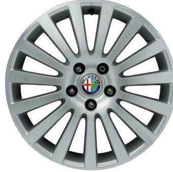
433 Ruote in lega leggera disegno a razze effetto diamantato 17"