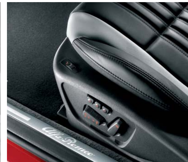
Regolazione altezza sedile