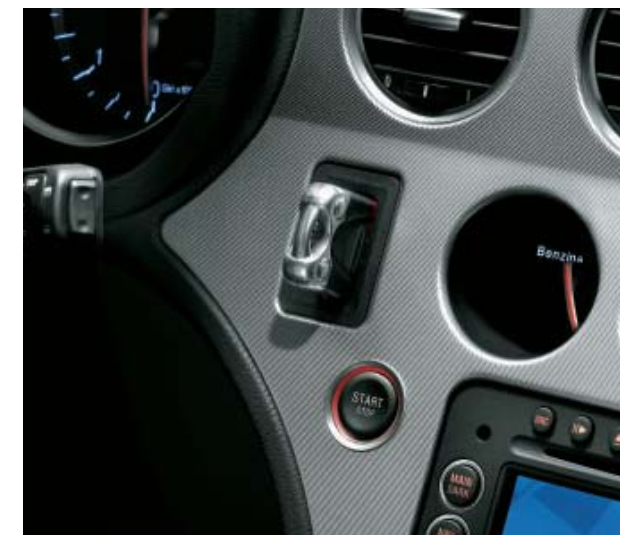
Chiave elettronica e pulsante avviamento