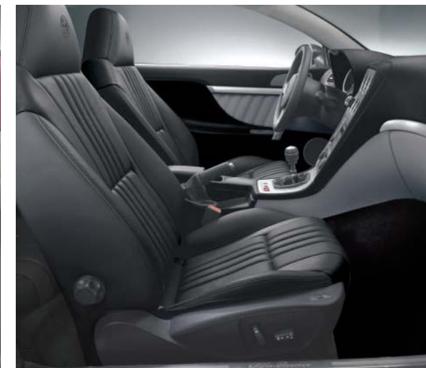
908 Pelle Frau® "Pieno Fiore" Nero