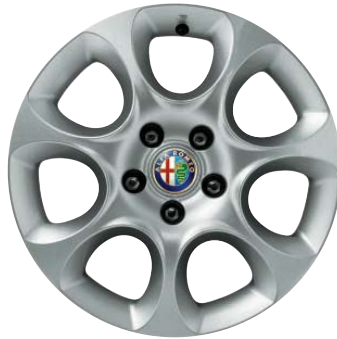
431 Ruote in lega leggera disegno a fori 16"