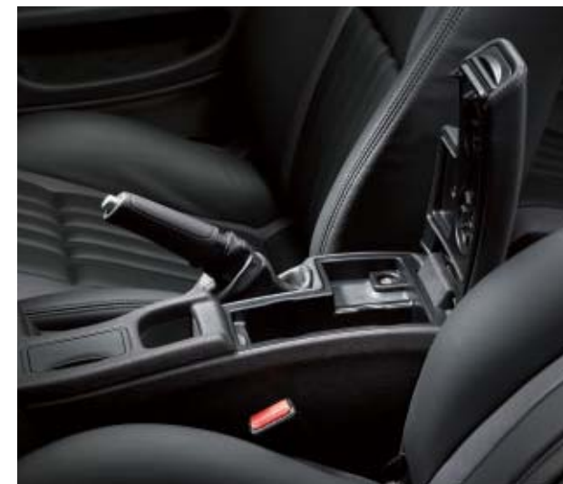
Bracciolo anteriore con vano portaoggetti