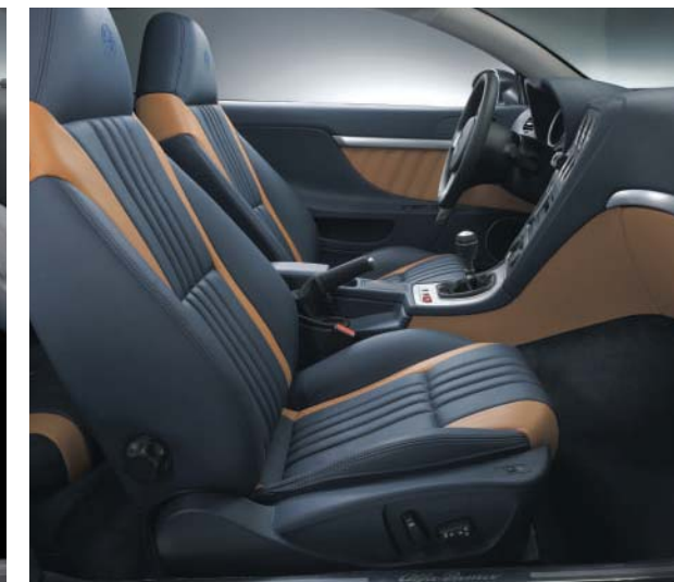
909 Pelle Frau® "Pieno Fiore" Blu / Tabacco