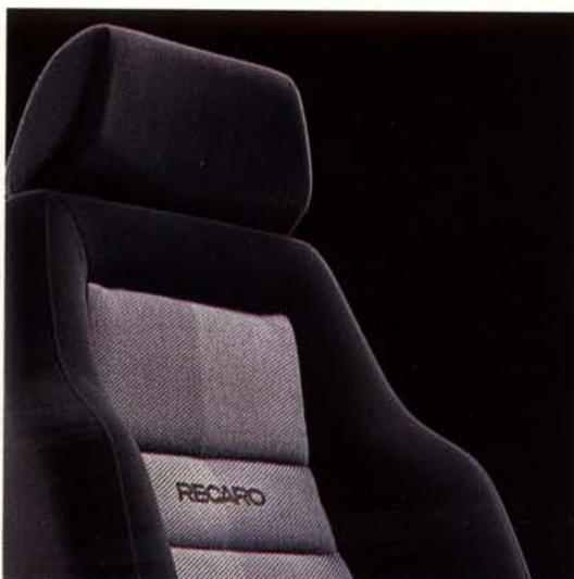
Sedili Recaro anatomici, per il massimo comfort.