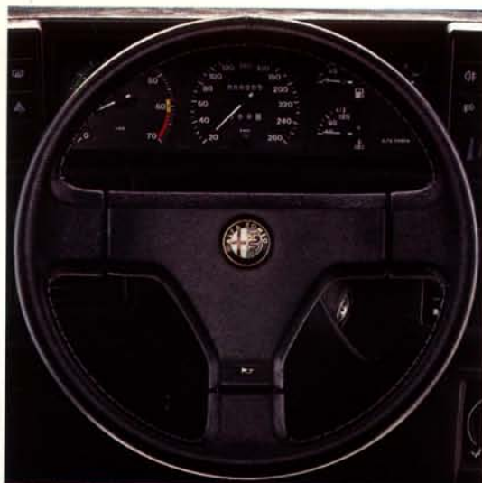
Perfetta la presa del volante regolabile, rivestito in pelle.