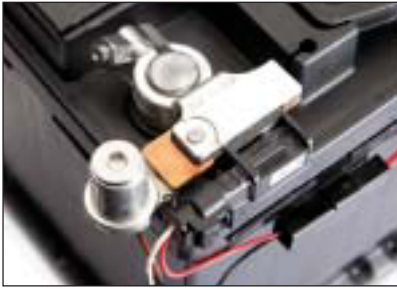
Montaggio sul polo standard della batteria (L'adattatore per il polo della batteria non è fornito in dotazione).

L'elettronica è inserita in un corpo esterno sigillato con connettore come interfaccia verso la gestione energia. L'interfaccia di comunicazione verso la centralina di livello superiore è il protocollo LIN. La tensione di alimentazione, che viene usata contemporaneamente come tensione di riferimento per la misurazione della tensione, viene messa a disposizione attraverso il collegamento al polo positivo della batteria.