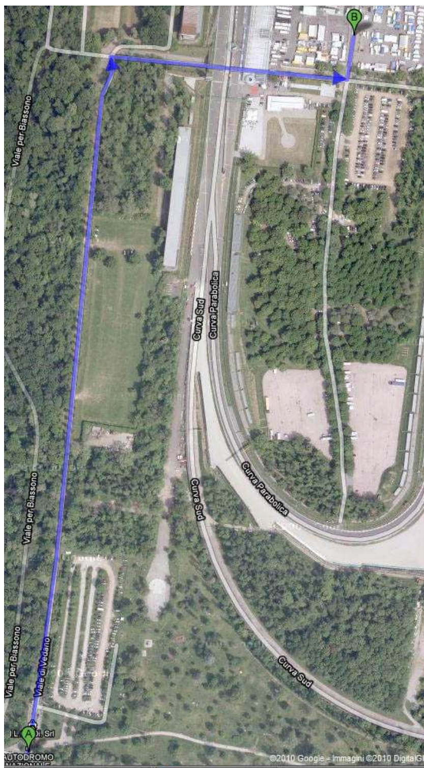
Figura 3 – dalla guardiola di accesso all'autodromo fino al Park riservato