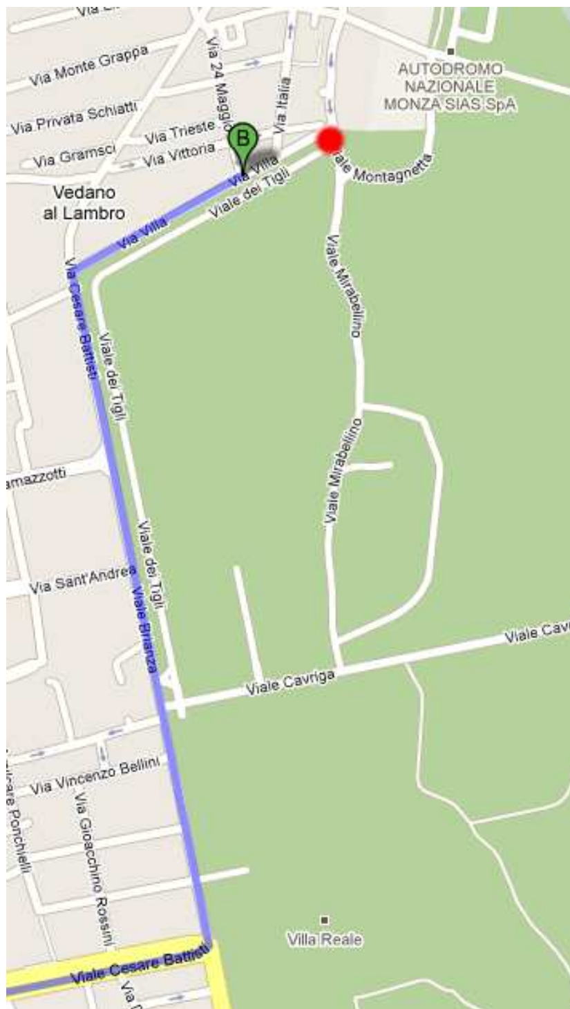
Figura 1 - Dalla Villa Reale fino all'ingresso dell'autodromo (in rosso in figura)